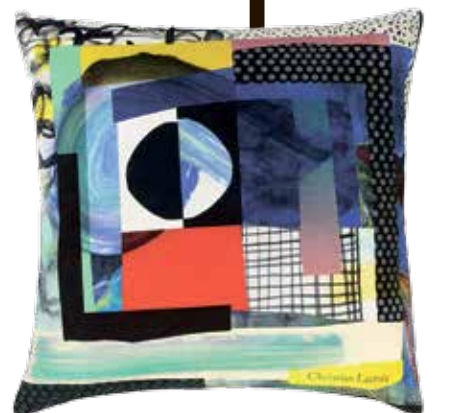
אינטרפרטציה ססגונית לטבע, בהדפסים למוצרים מעוצבים מבית כריסטיאן ליקוואה. עלית הלבושה לבית

יקום מי שלא שמע באיזשהו סיור גלריה את המשפט "גם הילד שלי יודע לצייר כמו פיקאסו". מה