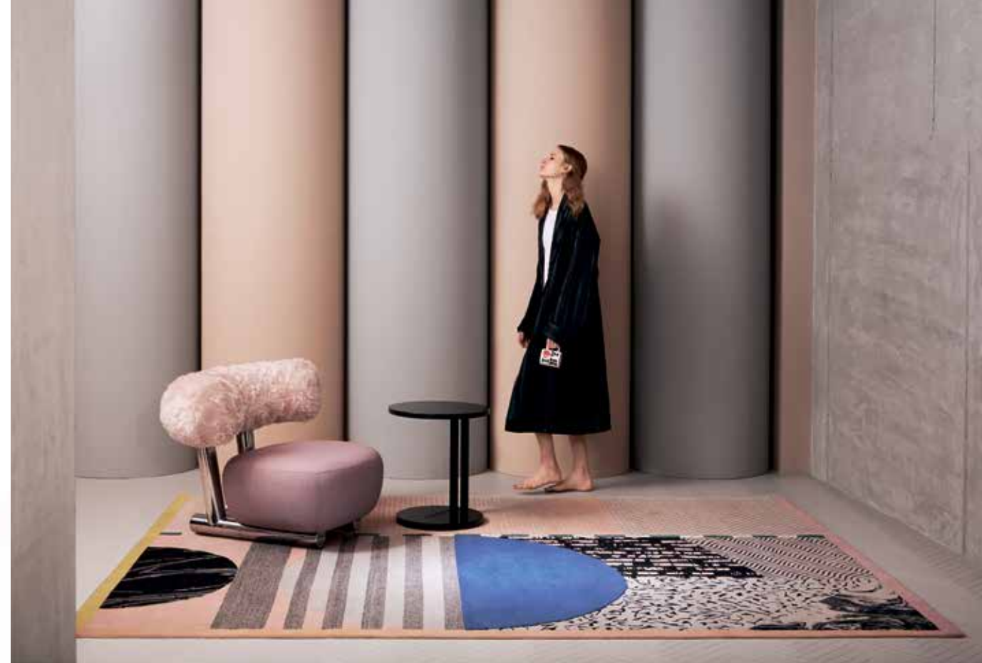
שטיח בעיצוב אלכס פרובה לחברת CC-Tapis. רשת נולמניס

להעז, לרגש ולהפתיע אכן, אינטרפרטציות רבות ניתנו לעיצובים של ממפיס בשנים