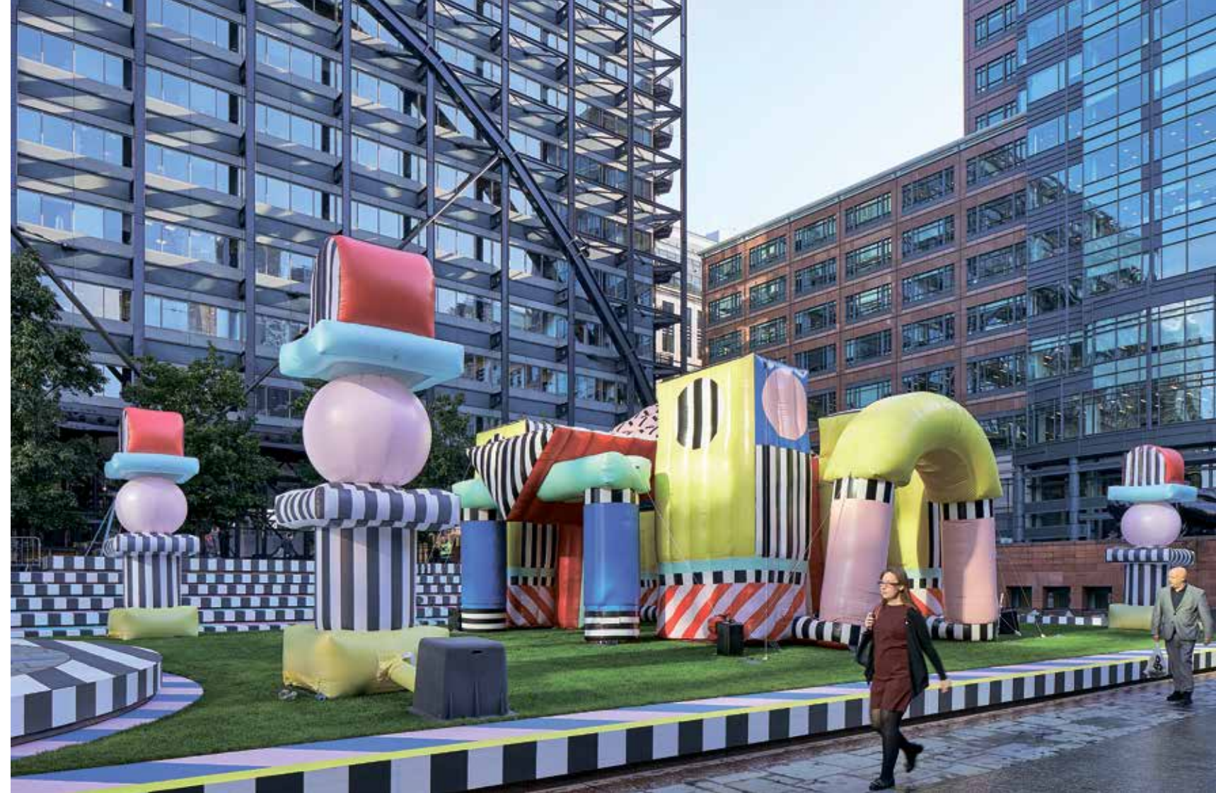
מבנה מתנפח בפסטיבל העיצוב 2017 בלונדון, בעיצוב קמיל וואלאלה