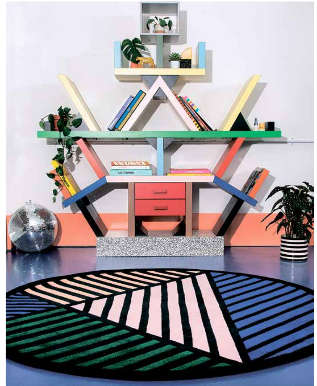
שטיח בצבעוניות עזה, בעיצוב קמיל וואלאלה, בשיתוף חברת FLOOR STORY, והמדפים האינקויניים מדגם Carlton, בעיצוב אטורה סוטסטס

הריטים ואבירי דגש שובבים וצבעוניים עם קריצה. הקבוצה ספגה השראה מתנועות כמו האר-דקו והפופ-ארט, וגם מסגנונות הקיטש וממוטיבים עתידיניים. התוצאה נדמחה, לעיתים, לצעצוע שפורק לגורמים ואז הורכב מחדש, בצורה שונה מהמקובל. שילובים של חומרים שונים, פטרנים גיאומטריים, צורות א-סימטריות וגוונים נועזים - נעשו במעין שידוך המבקש לשבור את החוקים, לכדי יצירה שלמה. אחד מסימני ההיכר של יצירותיהם הוא פטי שחור/לבן ושאר פטרנים קופצניים, לצד גוונים עזים ועשירים, צורות עתידניות, רחוקות ורובוטיות ומוביילים המזכירים את עבודותיהם של חואן מירו הספרדי ואלכסנדר קלדר האמריקאי. תחילת דרכה של תנועת ממפיס הייתה בתערוכת העיצוב השנתית המובילה Salone del Mobile במילאנו. כבר בשנת 1981 הציגו חבריה רהיטים ואביזרים צבעוניים שזכו לפידבקים מסוגים שונים, הכל מלבד אדישות. מחיצות חדרים וכוורות ססגוניות, גופי תאורה ושאר שכיות חמה - כל אלה יוצרו בתפר שבין הסוריאליסטי לבין המודרני. הפריטים המעוצבים תוארו כביזאריים ולא מובנים, והיה מי שהגדיל בתיאורו וכינה את סגנונם כשידוך מאולץ בין סגנון הבאוהאוס למרכולתה של חנות הצעצועים לתינוקות, פישר פרייס. כיאה לסגנונות פורצי דרך ושונים מהמקובל, הקבלה ארכה זמן. רק בתחילת שנות התשעים, והרבה לאחר שהתפרקה הקבוצה בשנת 1988, התקבע הסגנון כפופולארי וכנס לפנתיאון העיצוב. אמנם הקבוצה התפרקה לקראת סוף שנות השמונים, אך השפעתה על עולם העיצוב ניכרת עד היום, וכולנו עדים לתחיית הסגנון מתוך אינטרפרטציות מופלאות.