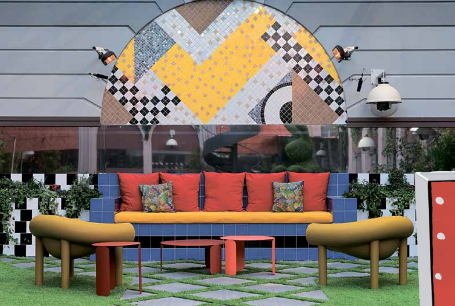
LESS IS MORE. בית האח הגדול 2020. חיפויים: אלוני. ניהול אמנותי וארט: רחלי לוי, עיצוב: שמרי גל נובק. מימין: אגרסל קרמיקה מדגם טוקיו, בצבעוניות משתנה משני צדי, בעיצובו של Roger Selden לקולקציה המתחדשת של ממפים גרופ, מבית Post Design באדיבות Paolo Rinaldi