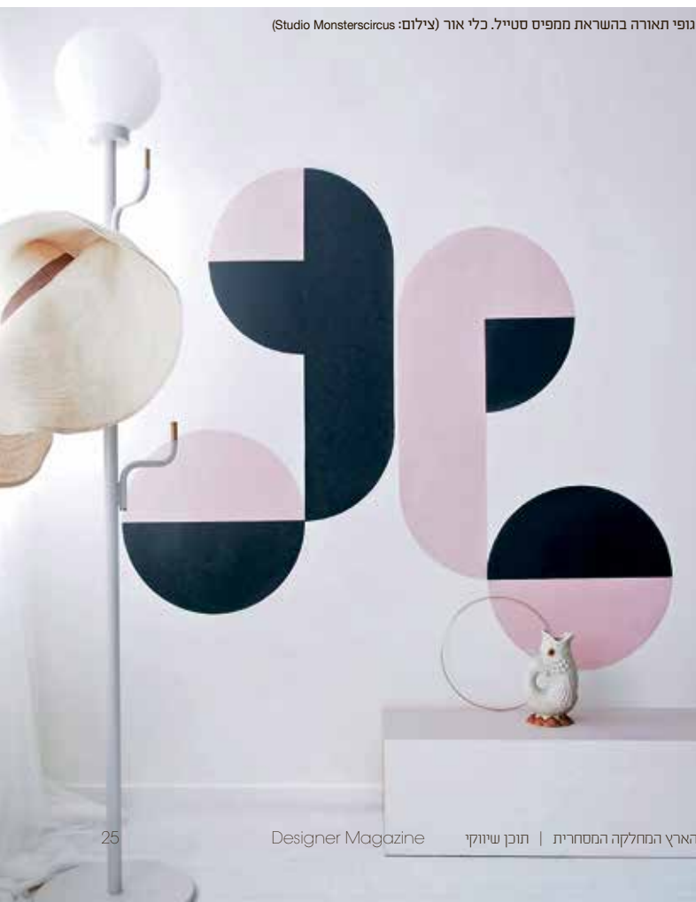
גופי תאורה בהשראת ממפים סטייל. כלי אור