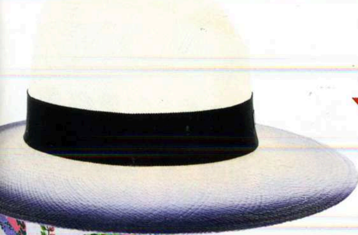
KID CREOLE'S NEW YORKSE GANGSTERLOOK IS COMPLEET MET DEZE RAFFIA TIE-DYE TRILBY-HOED VAN MAISON MICHEL, € 810.