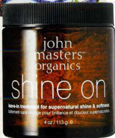
HAREN GLIMMEND VAN DE BRILLANTINE HOREN BIJ DE JAREN '30- EN '40-STIJL VAN KID CREOLE. SHINE ON LEAVE-IN-HAARCONDITIONER VAN JOHN MASTERS ORGANICS BESTAAT UIT NEGEN NATUURLIJKE INGREDIËNTEN, € 22.