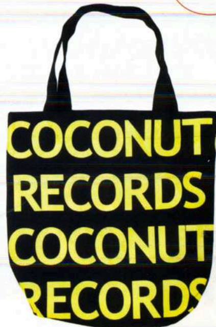
DRAAGTAS VAN COCONUT RECORDS, EEN MUZIKAAL PROJECT VAN DE AMERIKANSE ACTEUR EN MUZIKANT JASON SCHWARTZMAN. IN DE TAS ZIT EEN LIMITED EDITION 7-INCH WIT VINYL VAN DE BORED TO DEATH-SOUNDTRACK, € 22 (POKETO).