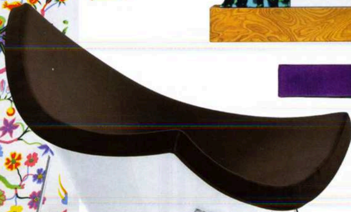
DE COCONUT CHAIR, ONTWERPEN DOOR GEORGE NELSON, WORDT WEL EEN 'IN ACHT PARTJES GEHAKTE KOKOSNOOT' GENOEMD. MET DE KLEUREN BINNENSTEBUITEN, € 4.000 (VITRA).