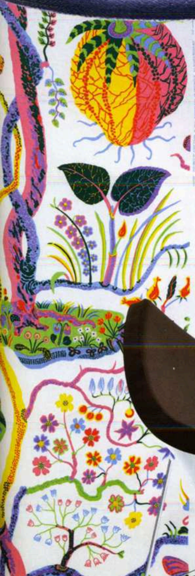
KID CREOLE VERWERKT IN ZIJN UNIEKE MUZIEKSTIJL EEN FLINKE SCHEUT TROPICANA . STOF HAWAII VAN HET ZWEEDSE LABEL SVENSKT TENN IS EEN ONTWERP VAN JOSEF FRANK UIT DE PERIODE 1943-1945. VAN KATOEN, 130 X 180 CM, € 104 P.M.