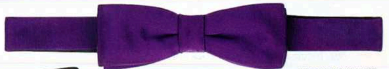
DE NAAM VAN HET ZELFGECEËERDE PERSONAGE VAN DE KID IS GEÏNSPIREERD OP DE FILM KING CREOLE UIT 1958, MET EEN JONGE ELVIS PRESLEY. VLINDERDAS VAN PAARSE SATIEN EN ZIJDE VAN PAUL SMITH, € 83.