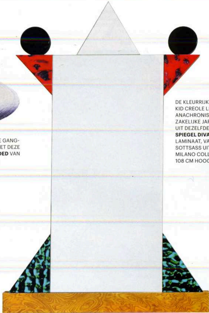
DE KLEURRIJKE EN FRIVOLE KID CREOLE LEEK EEN ANACHRONISME IN DE ZAKELIJKE JAREN TACHTIG. UIT DEZELFDE TIJD STAMT SPIEGEL DIVA , MET PLASTIC LAMINAAT, VAN ETTORE SOTTASS UIT DE MEMPHIS MILANO COLLECTION, 108 CM HOOG, € 1.738.