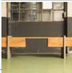
Cortesia de Giacomo