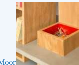
Moor Cortesia de Giacomo Moor