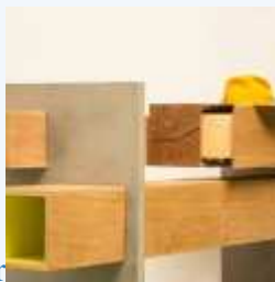
Cortesia de Giacomo