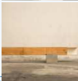
Cortesia de Giacomo