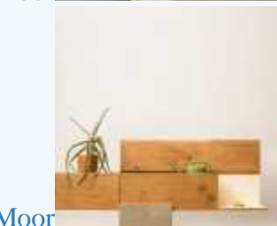
Moor Cortesia de Giacomo Moor