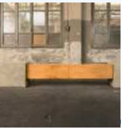
Cortesia de Giacomo Moor