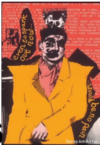
Постер Anti+Art Fair.