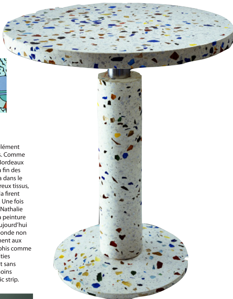
GUÉRIDON KYOTO DE SHIRO KURAMATA, 1983.

BEAUCOUP CROIENT de prime abord ce fauteuil satellitaire signé Mariscal. Erreur, c'est De Lucchi qui y assit toutes les années loft et postmodernes. First parce que premier. Et aussi, après coup, véritable best-seller pour Memphis. Un autre symbole toujours en orbite, à l'instar des autres créations de De Lucchi – verrerie, mobilier, sièges, également aussi proluxe que Sottsass.