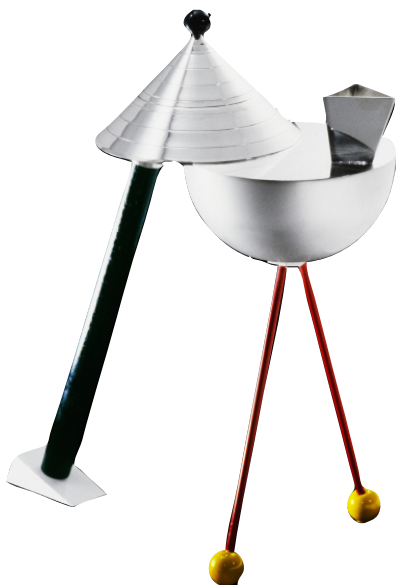
THÉIÈRE ANCORAGE DE PETER SHIRE, 1982.

TRANSFUGE ÉTRANGER de la première heure, l'Américain Peter Shire qui vit aujourd'hui en Californie, fut l'auteur du célèbre fauteuil Bel Air, véritable top-modèle tant il fit la couverture de magazines et d'ouvrages, comme le Style des années 80 par Sophie Anargyros (éd. Rivages). Pilier du jeu de pieds rond/carré/triangle, Shire greffa à Memphis quelques cellules rétro-streamline activées par une bonne dose de bolidisme. Sa théière Ancorage en argent et bronze, véritable Shadok à bec verseur ravive par défaut l'influence géométrique radicale des Wiener Werkstätte. Une rareté.