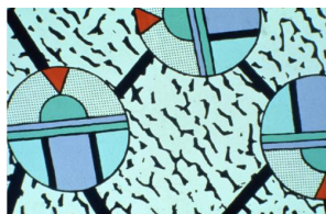
TISSU CERCHIO DE NATHALIE DU PASQUIER, 1983.

BIEN QUE MEMBRE FONDATEUR actif, Branzi aura peu créé pour Memphis. Cinq pièces dont l'étagère Gritti, tant copiée, et deux types d'assises dont cette dormeuse à accouder curseur monté sur roulettes. De profil, cette assise n'est pas sans évoquer l'univers de Mon Oncle vu par Tati. Une redécouverte dont la ligne générale modulaire préfigure avec vingt ans d'avance les tenants et aboutissants du minimalisme milanais en pervertissant joyeusement le divan freudien.