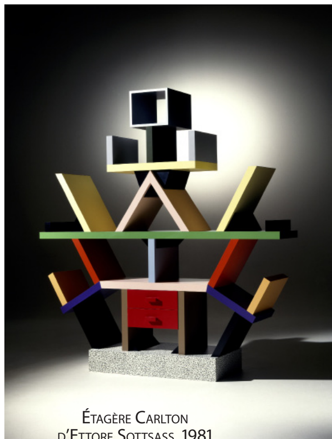
ÉTAGÈRE CARLTON D'ETTORE SOTTASS, 1981.

CHANTRE DE L'ANTIDÉSIGN rationaliste, Sottsass (1917-2007) est à l'époque déjà un vieux routier de la scène milanaise : il occupe le terrain, le devant de la scène et de la presse depuis le début des années 1960 et a été de tous les mouvements contestataires quand il ne les a pas initiés lui-même. Locomotive du groupe Memphis, Sottsass en fut naturellement le plus prolifique des acteurs. Touche-à-tout – mobilier, lampes, céramique, argenterie –, il est aussi l'auteur de l'étagère Carlton considérée comme l'emblème tutélaire de la marque. Douze couleurs, deux tiroirs, une silhouette de dieu aztèque pour un triomphe du stratifié dont la cotation en salle des ventes peut dépasser allègrement les 9 000 €. Une édition spéciale a été produite en 2011 pour marquer son 30 e anniversaire. Il existe aussi une version miniature à l'échelle 1/4 de ce monument, produite à 1 000 exemplaires.