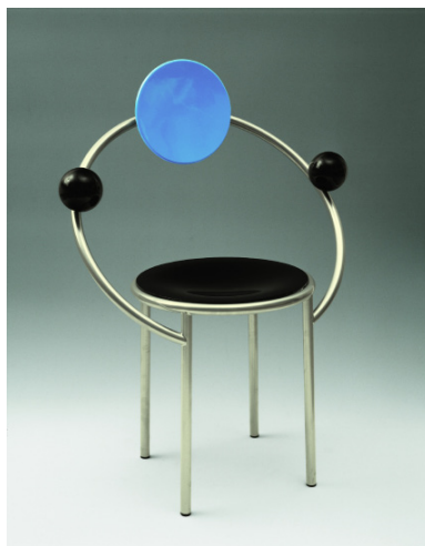
FAUTEUIL FIRST DE MICHELE DE LUCCHI, 1983.

AVEC MARTINE BEDIN, Nathalie Du Pasquier fut l'autre seul élément féminin du groupe Memphis. Comme Bedin, elle est originaire de Bordeaux et s'était installée à Milan à la fin des années 1970. Artiste, elle créa dans le cadre de Memphis de nombreux tissus, tapis, objets et meubles qui la firent glisser dans la case designer. Une fois le groupe Memphis dissout, Nathalie Du Pasquier se tourna vers la peinture et la sculpture. Elle expose aujourd'hui son travail partout dans le monde non sans collaborer sporadiquement aux collections ultérieures Memphis comme en 2005 avec Life's Commodities pour Post Design. Cerchio est sans doute son dessin textile le moins ethnique, le plus op art-comic strip.