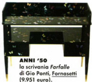
ANNI '50 la scrivania Farfalle di Gio Ponti, Fornasetti (9.951 euro).