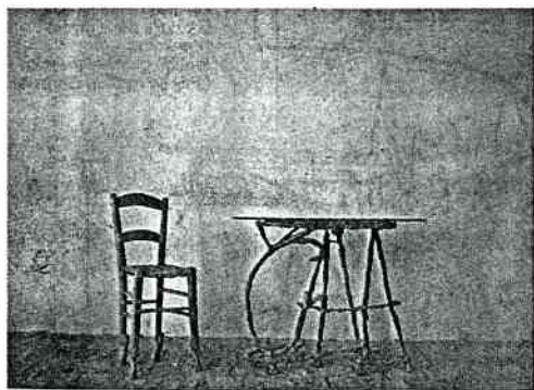
Sandro Chia: tavolo e sedia di bronzo e vetro. Sandro Chia: bronzes and glass table and chair.