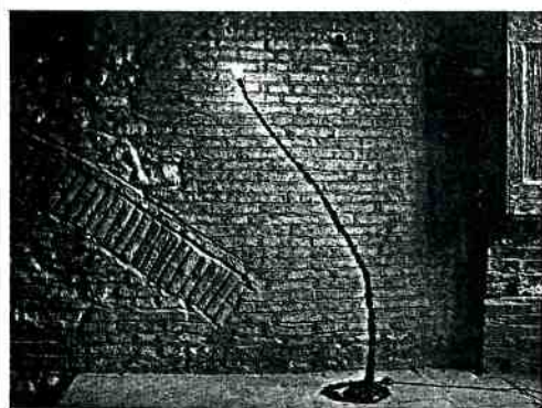
Franz West: lampada da terra di ferro. Franz West: iron floor lamp.

→ mostra allestita in giugno presso il Palazzo Querini Stampalia di Venezia. L'esposizione, organizzata dagli Incontri Internazionali d'Arte di Roma e dalla Fondazione Scientifica Querini Stampalia con il contributo di Artemide e del Banco San Marco, era accompagnata da un catalogo pubblicato da De Agostini con saggi di Virginia Baradel, Bruno Corà, Marco De Michelis e foto di Luigi Ghirri.