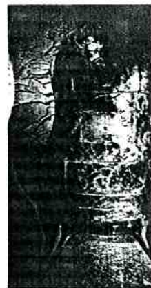
Mark Newson: mobile con ca- "Pod Chest".