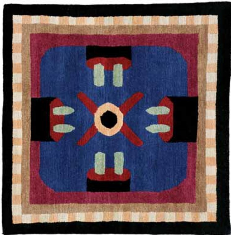
NDP35 60 x 220