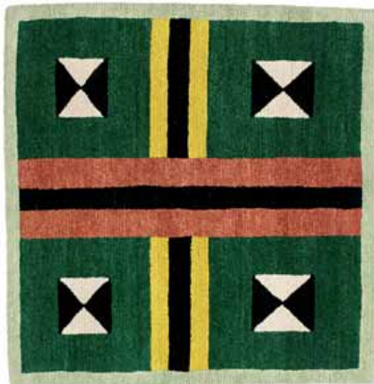
NDP18 Ø 90