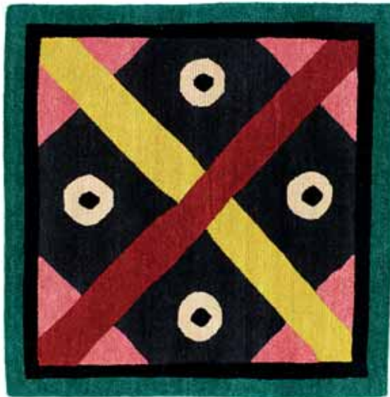
NDP23 90 x 90