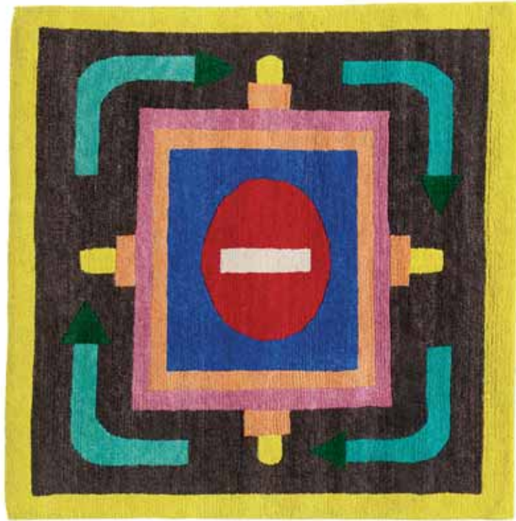
NDP27 120 x 120