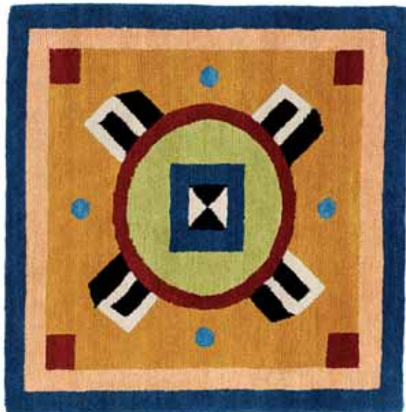
NDP20 90 x 90