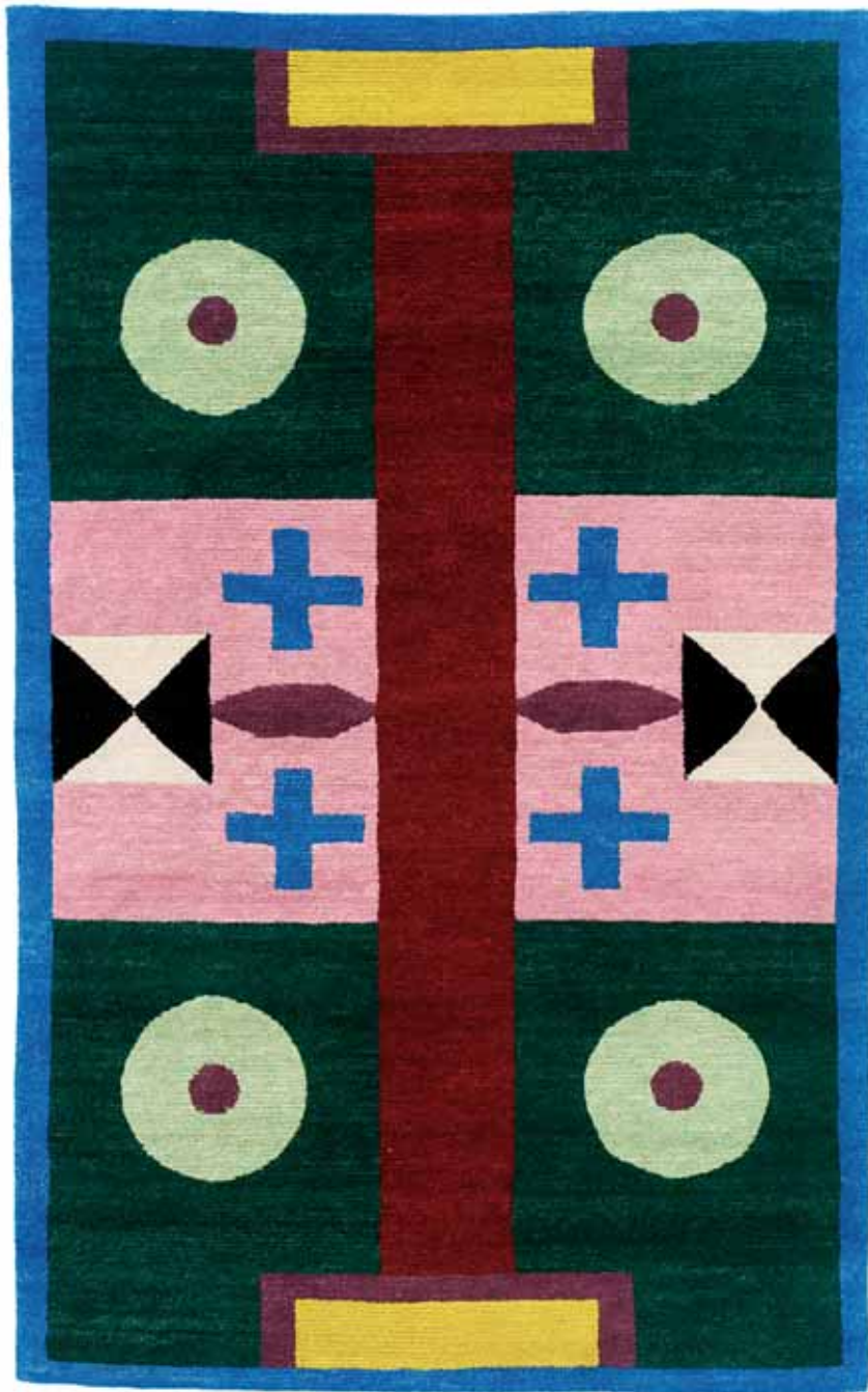
NDP32 130 x 210