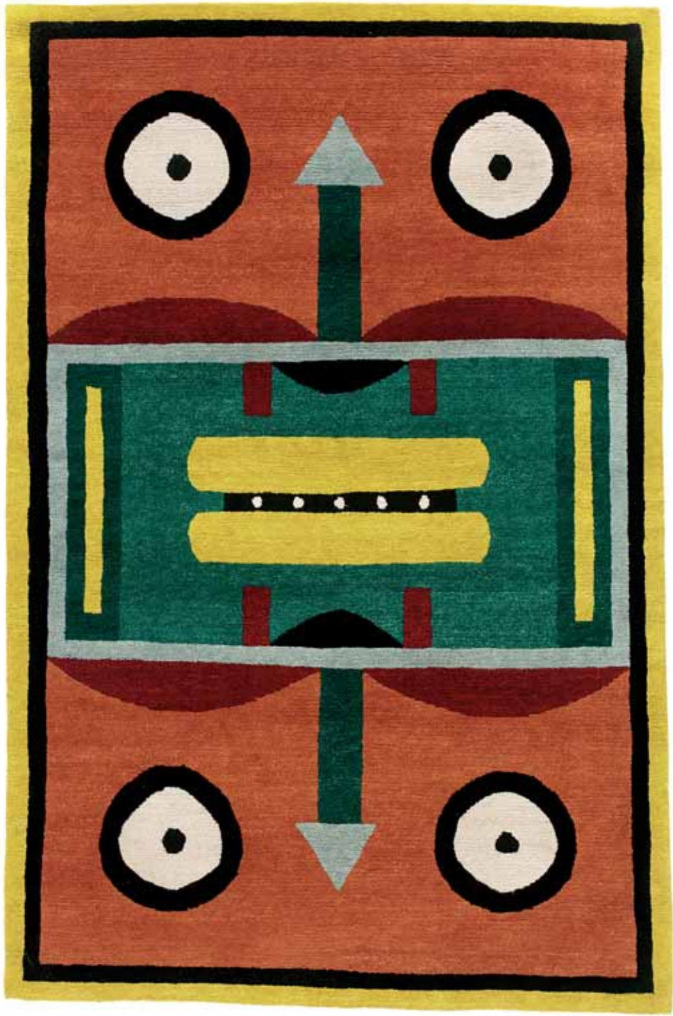
NDP43 160 x 230