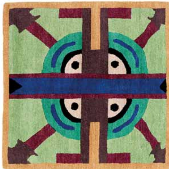
NDP33 110 x 210