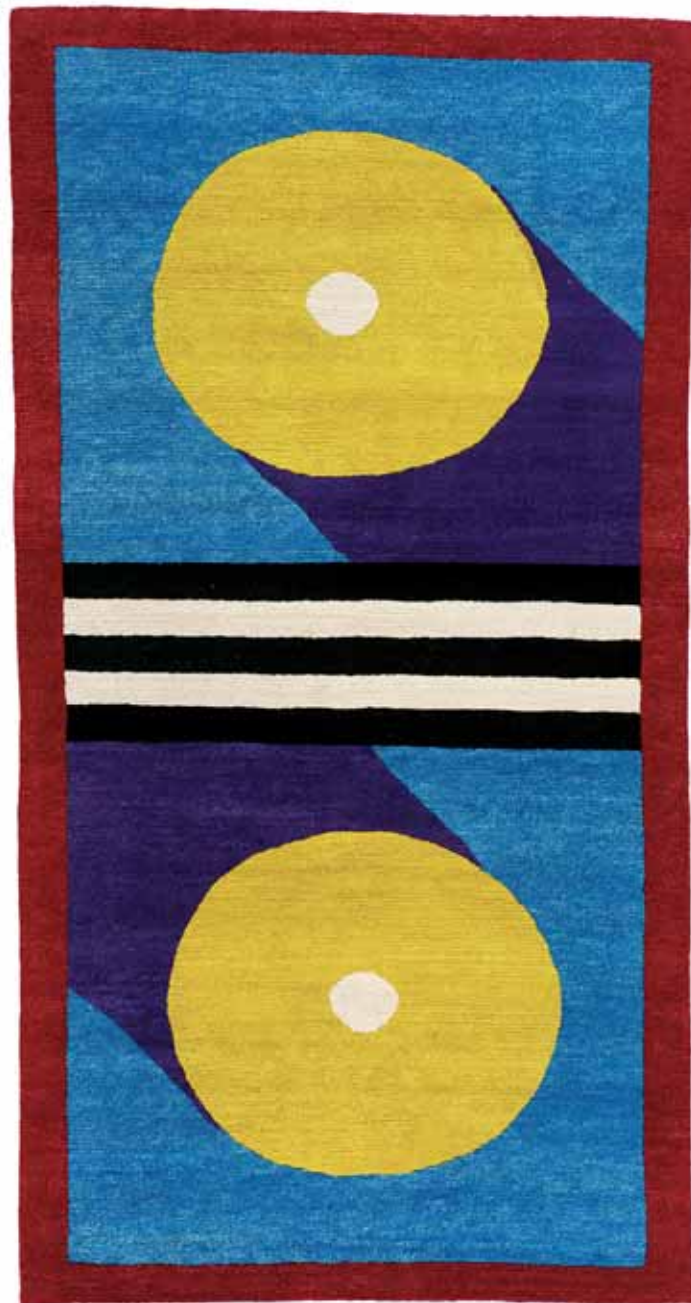
NDP31 110 x 210