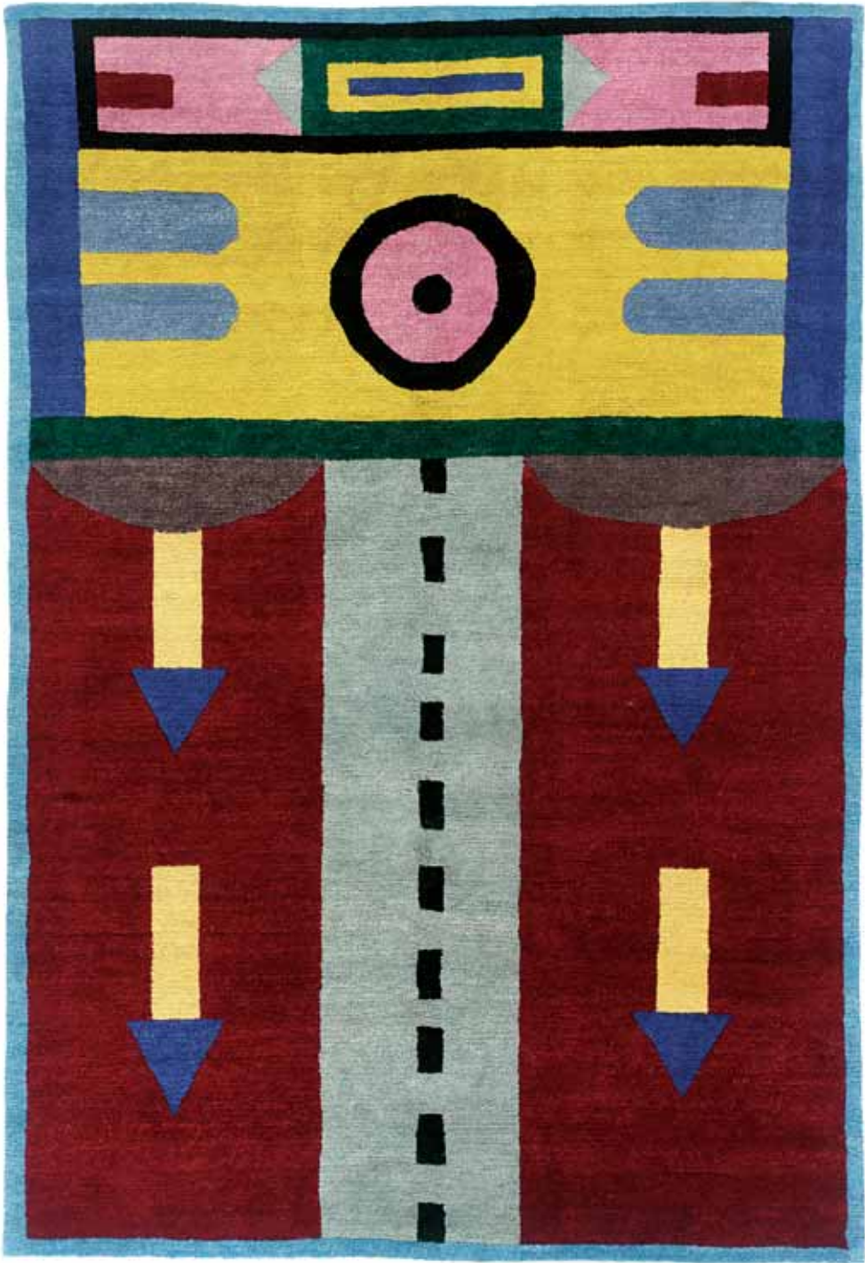
NDP42 160 x 230