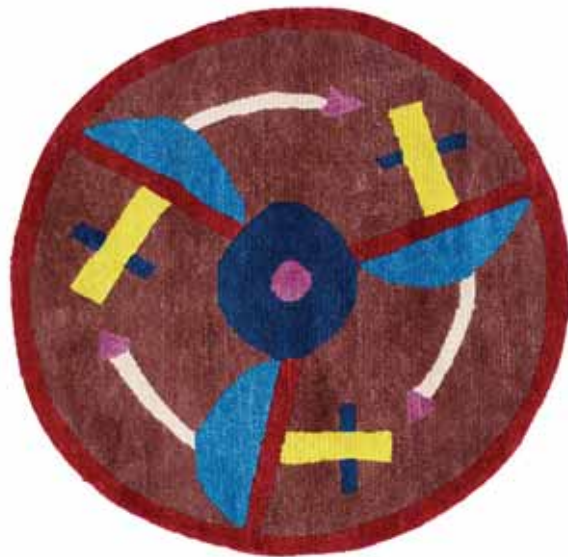
NDP21 90 x 90