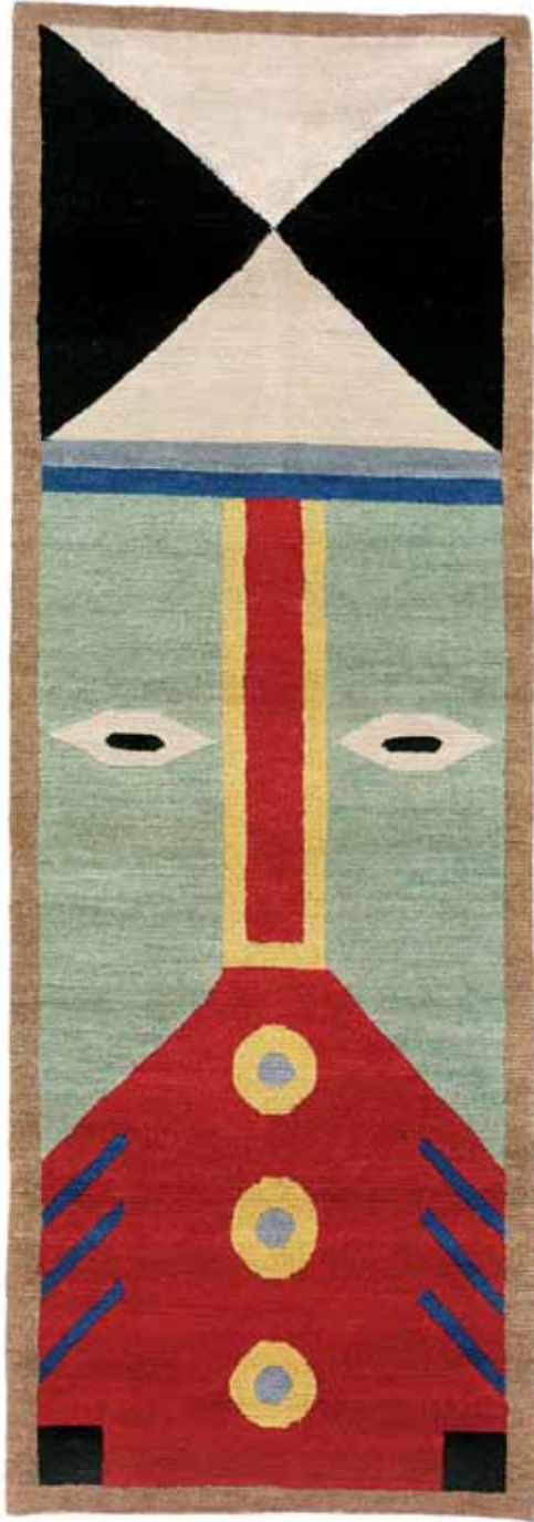
NDP37 75 x 220