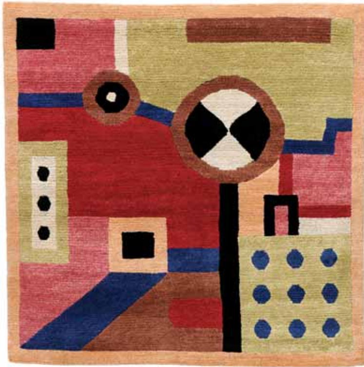
NDP26 120 x 120