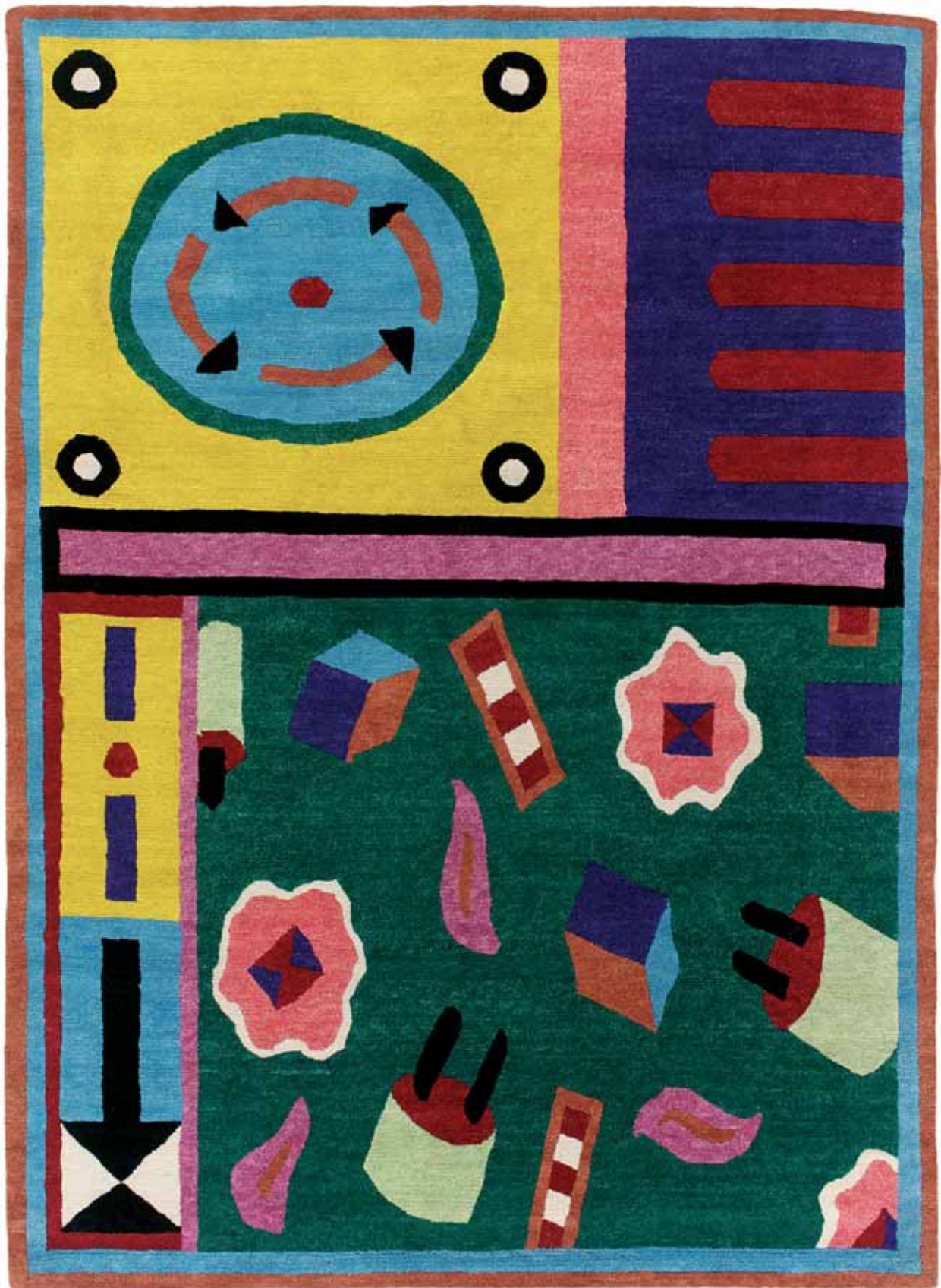
NDP28 200 x 275