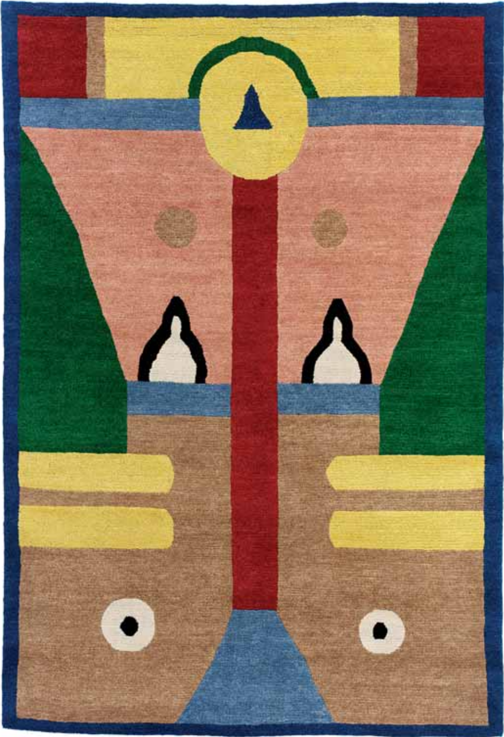
NDP41 160 x 230